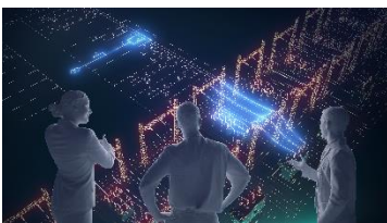
Voilà l'essence d' Engineering Base : toutes les disciplines, y compris les systèmes de protection et de commande, ont accès au modèle de données consolidé, ce qui permet de disposer de données cohérentes et à jour, et d'un environnement outils et systèmes considérablement allégé.